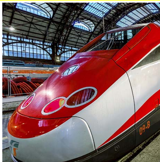
La Regione si oppone ai nuovi aumenti

Presenza di posizione della Regione Piemonte contro gli aumenti degli abbonamenti dei treni Frecciarossa sulla tratta Torino-Milano. Il presidente Sergio Chiamparino e l'assessore ai Trasporti, Francesco Balocco, hanno dichiarato che sapevano solo che Trenitalia avrebbe diversificato gli abbonamenti, differenziando fra i 5 e i 7 giorni: «Non eravamo certo stati avvisati di questi aumenti spropositati. Evidentemente l'obiettivo è quello di disincentivare i pendolari, perché un incremento del 35% del costo del settimanale e del 20% di quello del periodo lunedì-venerdì non può che voler dire tenere lontani i