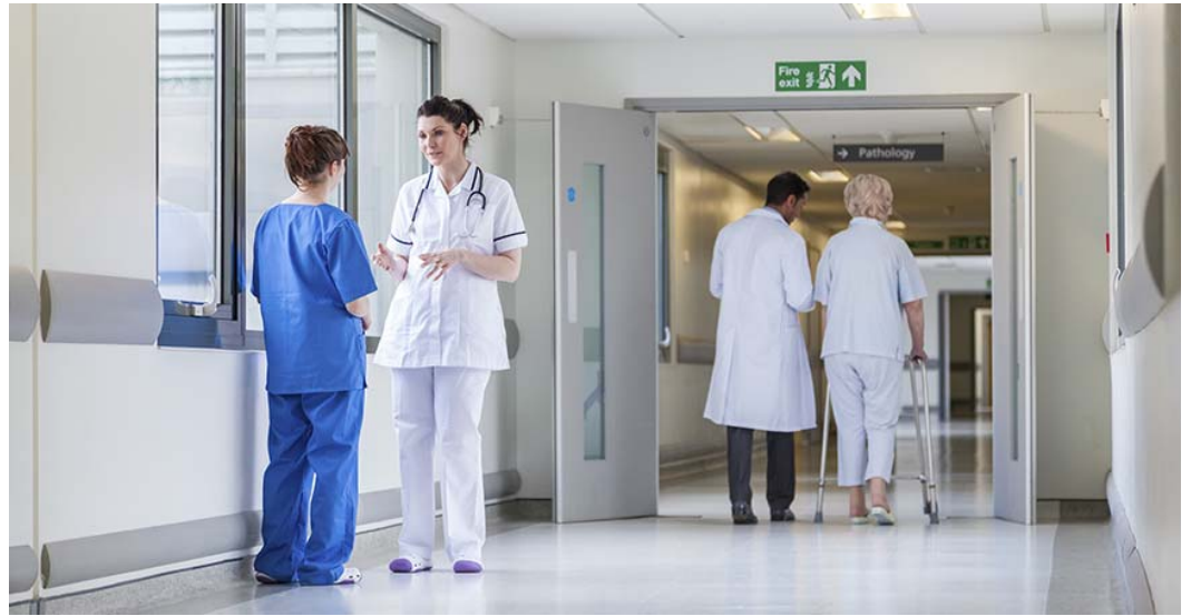
Le Case della salute saranno 54, almeno una per Distretto socio-sanitario

«Con la rete delle Case della Salute - ha ricordato Saitta - intendiamo creare punti di riferimento sul territorio per tutti i malati cronici e per i pazienti non gravi, lasciando agli ospedali il compito di occuparsi delle emergenze e delle prestazioni a grande specializzazione». Soddisfatti anche i segretari regionali Graziella Rogolino (Cgil), Sergio Melis (Cisl) e Franco Lo Grasso (Uil): «Con questo accordo inizia un percorso, da tempo oggetto di proposta del sindacato, di potenziamento della rete territoriale dei servizi. I piemontesi non saranno obbligati a fare ricorso solo alle