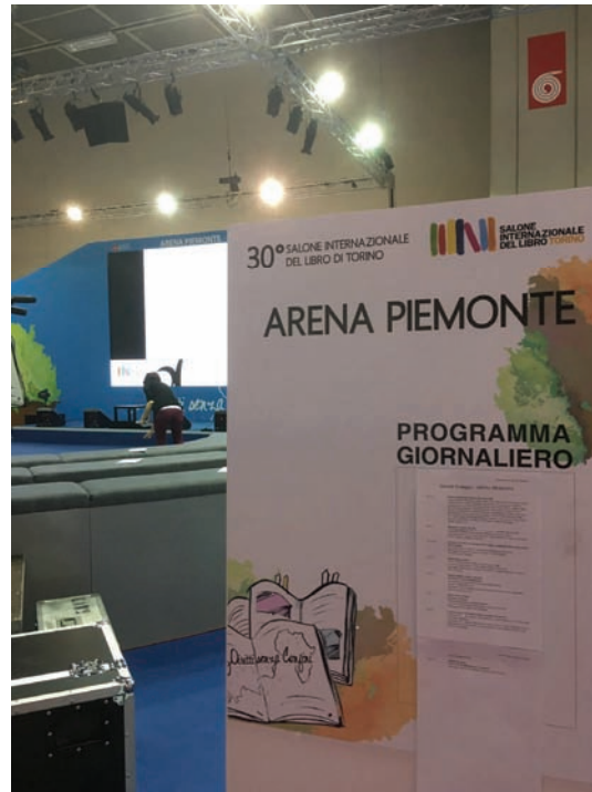
L'Arena Piemonte al Salone del Libro

Una delle novità più importanti della Regione per questo trentennale è rappresentata dal buono libro: un nuovo strumento, del valore di 15 euro, che sarà a disposizione degli studenti delle scuole superiori under 18 e utilizzabile per l'acquisto di un libro negli stand del Salone. Il buono sarà utilizzabile presso tutti gli stand degli espositori che hanno dichiarato la loro adesione e che esporranno opportuna segnaletica e presso le librerie presenti all'interno dello spazio espositivo del Salone: la Libreria dell'Arena Piemonte (Pad.3), la Libreria della Piazza dei lettori (Pad. 3), la Libreria a Stelle e Strisce (Pad. 2), Babel - La libreria internazionale (Pad. 3), la Libreria dei ragazzi (Pad. 5), la Libreria dello Spazio gasTrOnomica (Pad. 1). Ottomila buoni sono destinati alle scuole secondarie di secondo grado del Piemonte. Quattromila sono invece a disposizione dei