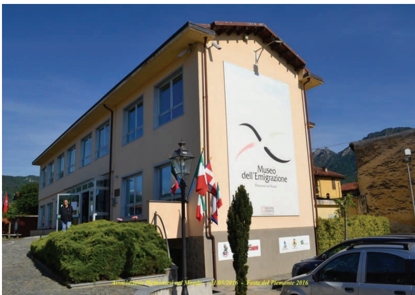
La sede del Museo regionale dell'Emigrazione, a Frossasco

convegni del Museo del Gusto, in via Principe Amedeo 42/A, ad una cinquantina di metri dal Museo dell'Emigrazione di piazza Donatori di Sangue 1. La festa del Piemonte celebra (come recita l'articolo 2 della legge regionale n.26 del 10 aprile 1990), il giorno anniversario della promulgazione dello Statuto regionale, avvenuta il 22 maggio 1971.