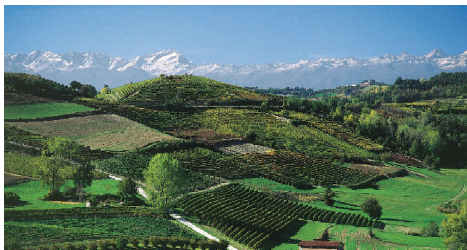
Nuovo regolamento per le strutture ricettive piemontesi

È l'albergo diffuso la nuova categoria di classificazione delle strutture ricettive piemontesi introdotta da un regolamento approvato il 15 maggio dalla Giunta regionale: caratterizzato da uno stabile principale, destinato ad accogliere i servizi di uso comune, collegato ad una serie di locali distanti fino a