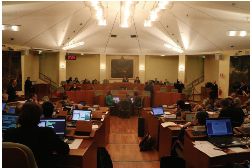
La seduta del Consiglio regionale di mercoledì 12 aprile

rurale dal 2007 al 2020; 5 milioni per il sistema neve, destinati soprattutto alle stazioni sciistiche più piccole; 250.000 a sostegno delle attività delle Pro Loco; un milione di euro in più al fondo per le morosità incolpevoli; 250.000 euro per l'Agenzia regionale adozioni internazionali; 100.000 euro per le minoranza linguistiche; 1 milione per la