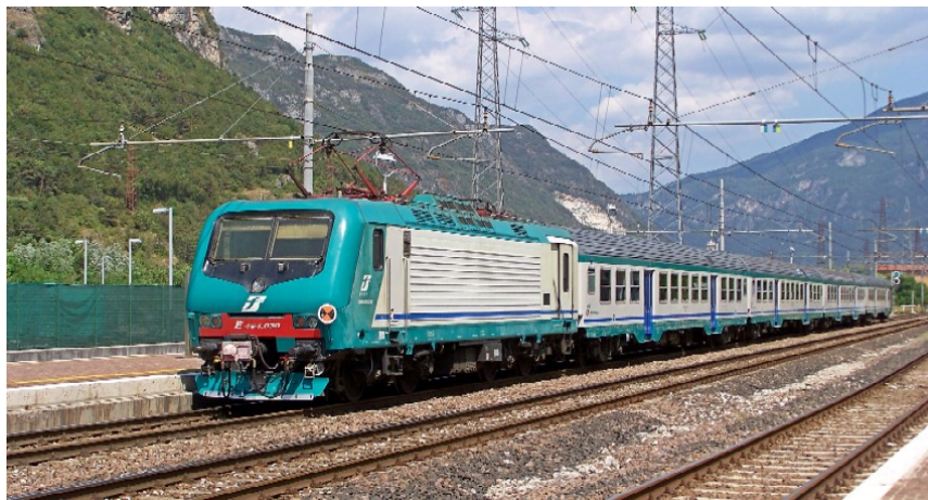
Il risultato è giunto dopo un lavoro di mediazione con Trenitalia

Da gennaio i treni Frecciabianca soppressi da Trenitalia sulla linea Torino-Milano saranno sostituiti con i nuovi regionali Fast. Ci saranno tre coppie di treni che fermeranno solo a Vercelli, Novara e Rho attestandosi a Milano Porta Garibaldi. I tempi di