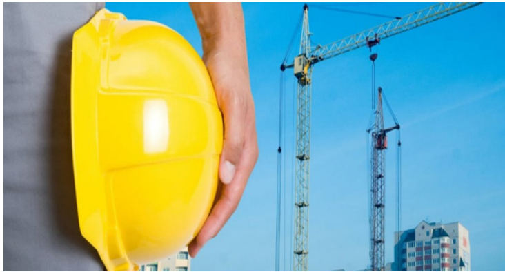
Il Patto è stato presentato lunedì 28 novembre in Regione

Cinque assi strategici per sei miliardi di interventi: sono queste le indicazioni contenute nel Patto tra Governo, Regione Piemonte e Città di Torino, un'importante strumento di programmazione e di coordinamento tra le istitu-