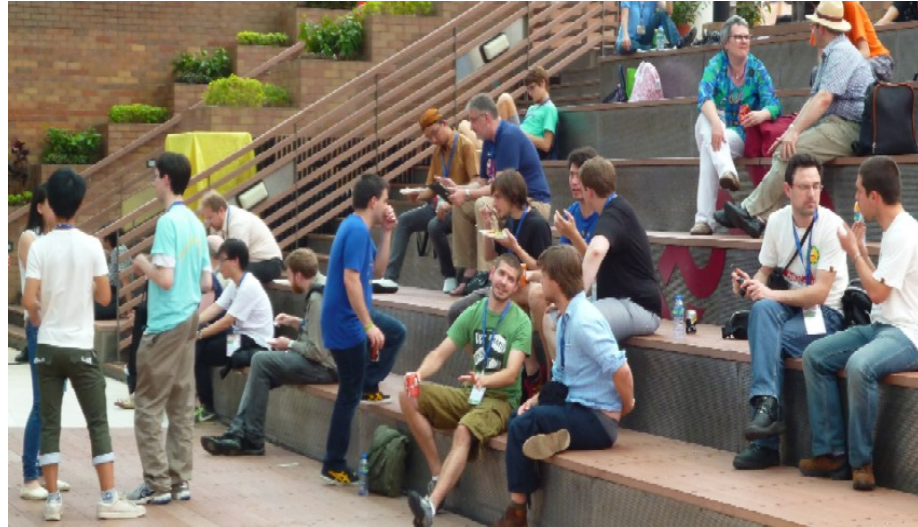
Il Bilancio sociale vuole rendere comprensibili a tutti gli atti principali dell'ente

- ottimi i risultati sul recupero dell'evasione fiscale: 105 milioni tra Irap, Irpef e bollo auto, un risultato rilevante cui bisogna sommare i 90 milioni recuperati finora nel 2016, a testimonianza