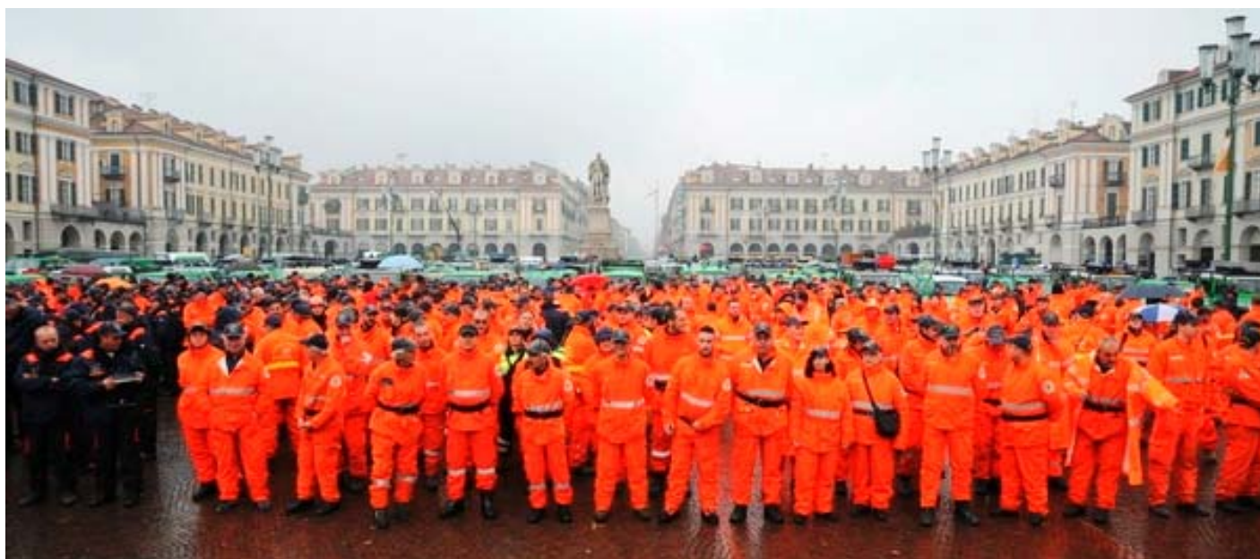
Volontari Aib (Antincendi boschivi) del Piemonte durante un raduno e, sotto momenti di un intervento

La Regione Piemonte, inoltre, come tutto il sistema nazionale di Protezione civile, è intervenuto in centro Italia con numerosi volontari attraverso le associazioni nazionali con unità cinofile, struttura protetta per l'infanzia, attività di sorveglianza, assistenza alla popolazione, oltre all'intervento diretto delle strutture regionali per le valutazioni di agibilità degli edifici.