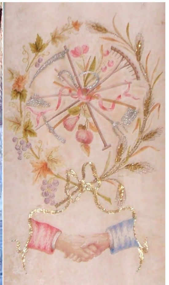
La bandiera storica della Soms di Sant'Anna dei Boschi e, a destra, le "mani in fede", simbolo storico del mutuo soccorso

Sarà esposto anche lo storico "Grand Drapò" della Regione Piemonte