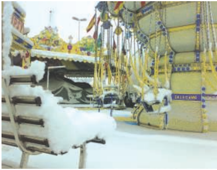
Luna Park innevato mercoledì mattina in piazza d'Armi

Nei propositi degli organizzatori dovrà essere la Fiera del rilancio, all'insegna della promozione dei prodotti tipici che